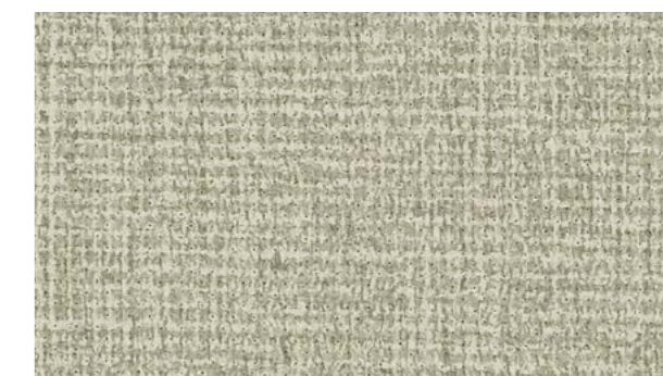
SIAN 9181 04 69 Matcha