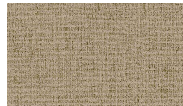
SIAN 9181 10 22 Chamois