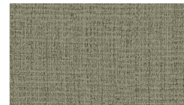
SIAN 9181 04 83 Mousse