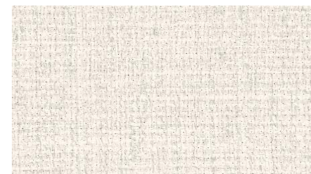
SIAN 9181 01 36 Beige clair