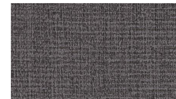
SIAN 9181 11 94 Anthracite