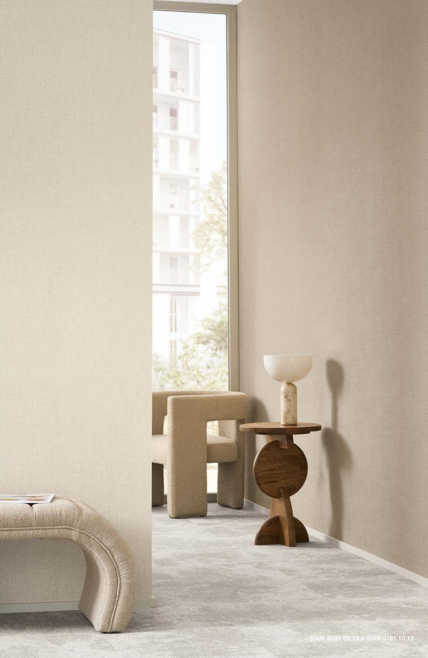
SIAN 9181 02 13 & SIAN 9181 10 18