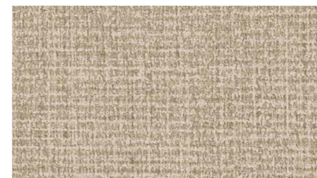
SIAN 9181 10 18 Noisette