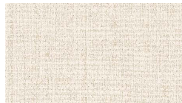
SIAN 9181 01 24 Ivoire