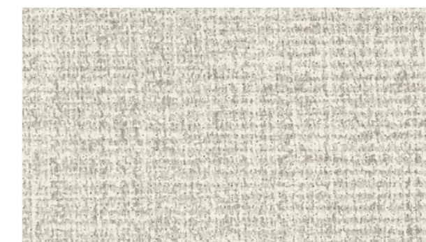
SIAN 9181 04 21 Vert d'eau