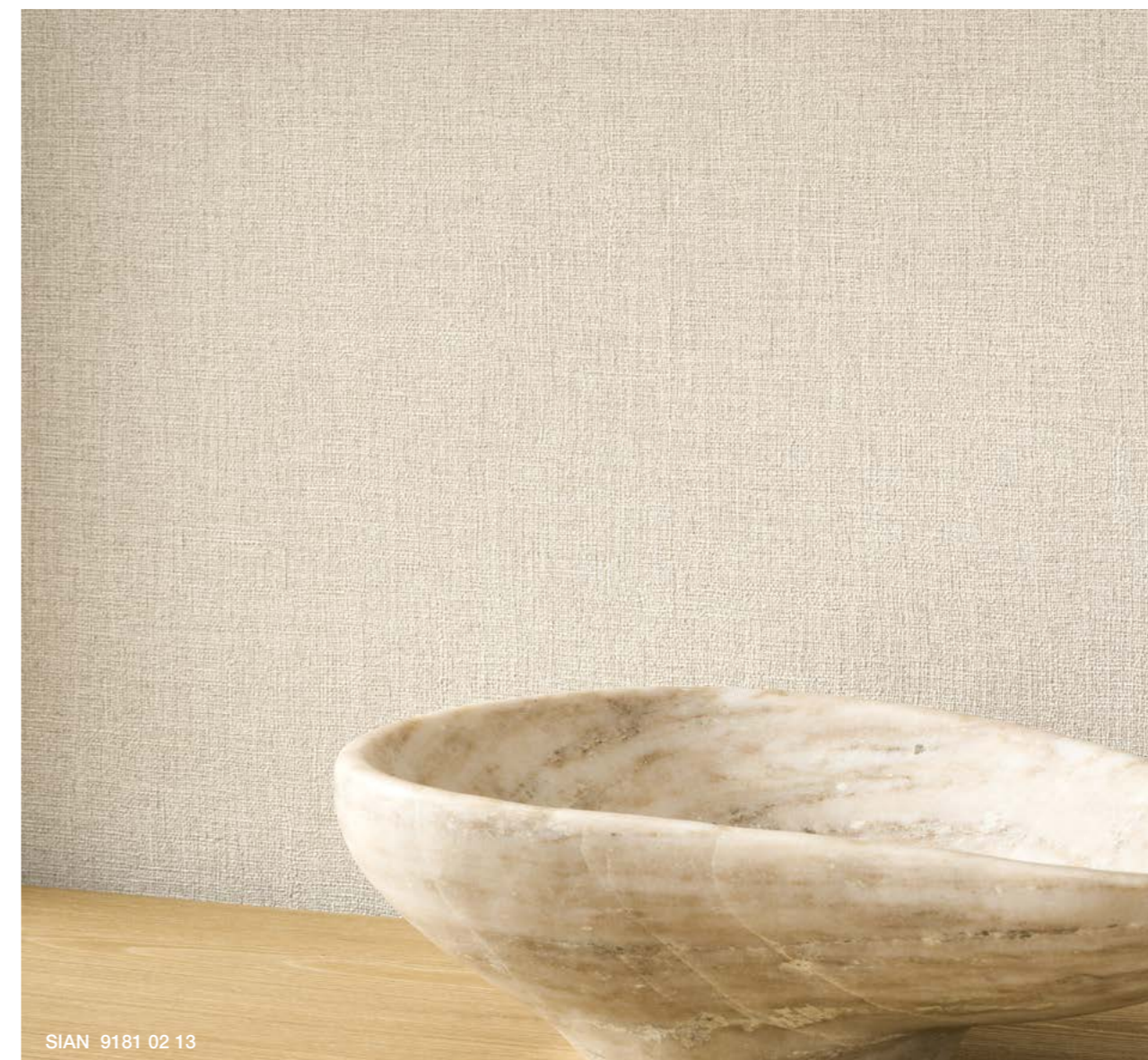
SIAN 9181 02 13