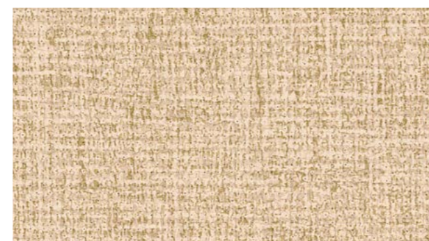
SIAN 9181 02 10 Praline