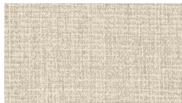
SIAN 9181 02 26 Naturel