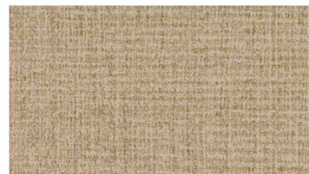
SIAN 9181 10 04 Camel