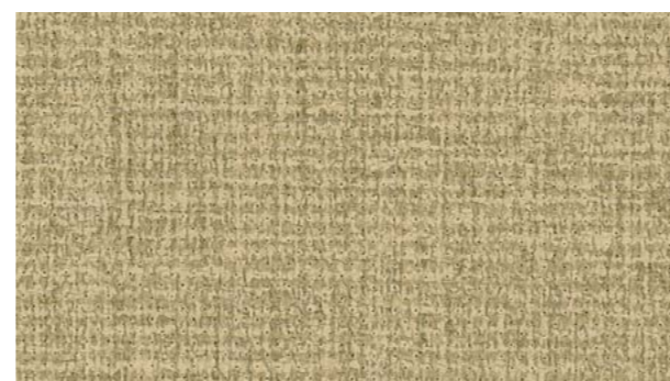
SIAN 9181 10 46 Mordoré