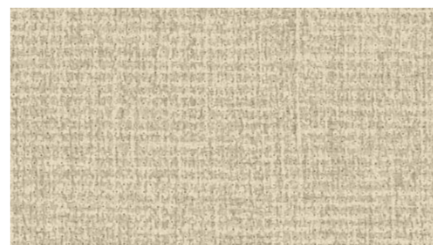
SIAN 9181 02 35 Sable