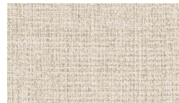
SIAN 9181 02 13 Beige