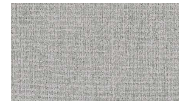
SIAN 9181 11 52 Givre