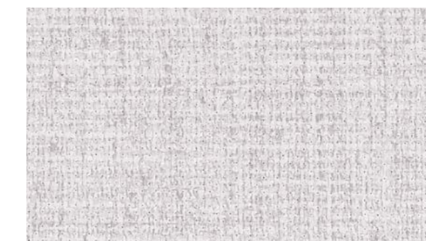
SIAN 9181 11 06 Neige