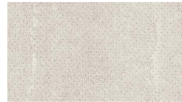
VSTO 9054 23 04