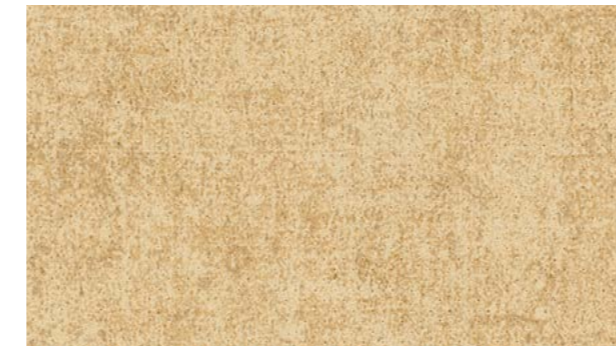
VSTO 9171 03 51