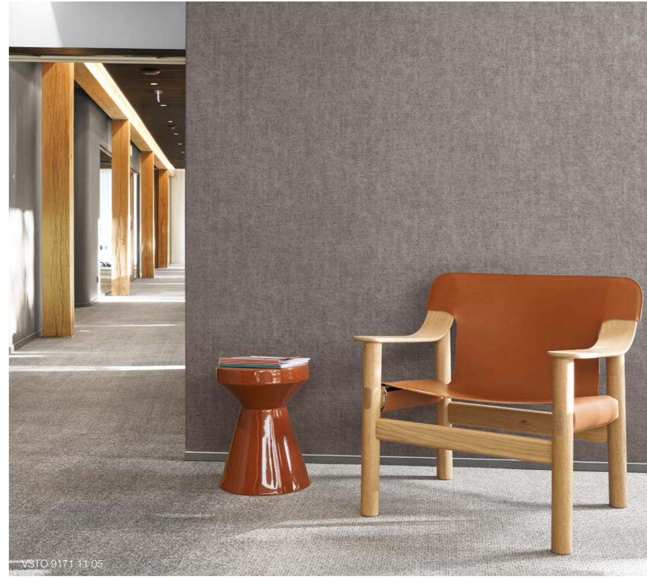
VSTO 9171 11 05