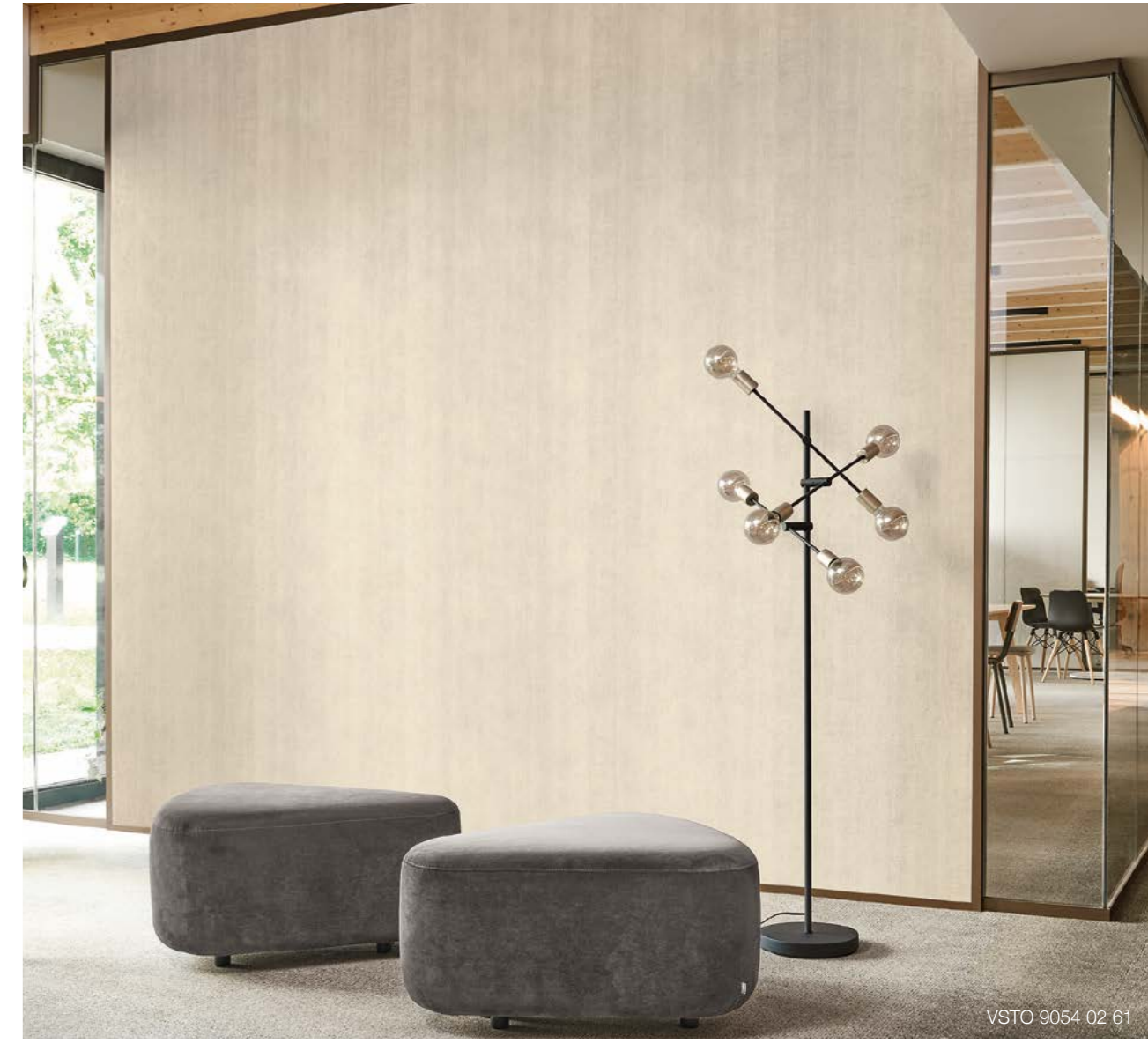
VSTO 9054 02 61