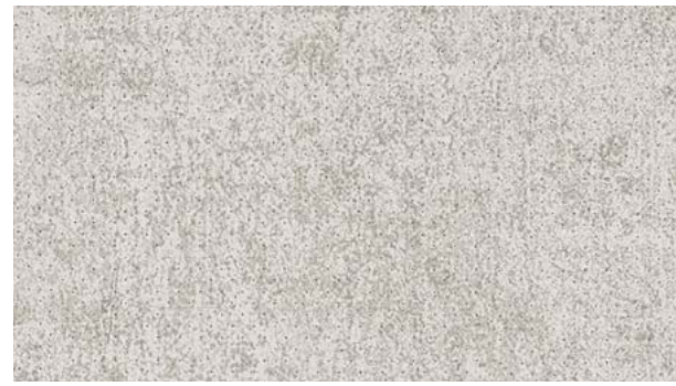
VSTO 9171 10 72