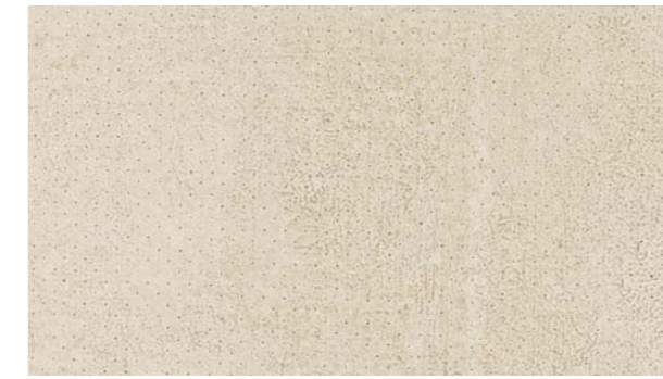
VSTO 9054 02 61