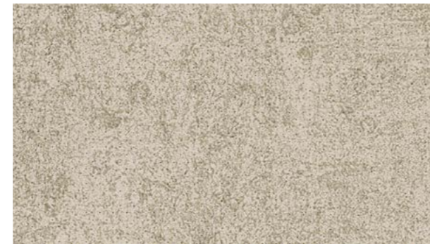
VSTO 9171 02 15