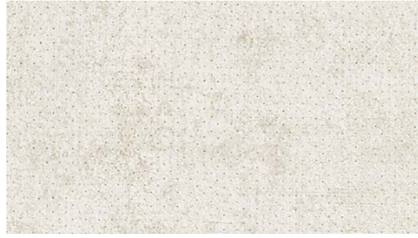
VSTO 9171 01 27