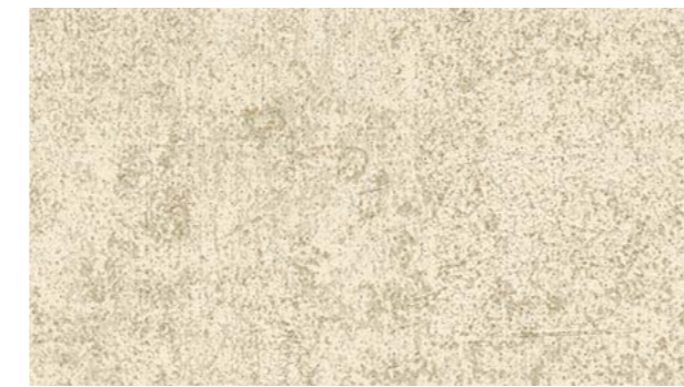
VSTO 9171 02 36