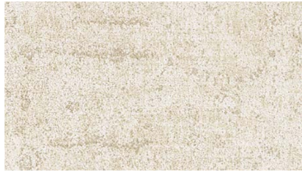
VSTO 9171 01 12