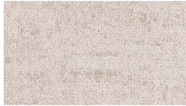
VSTO 9171 10 41