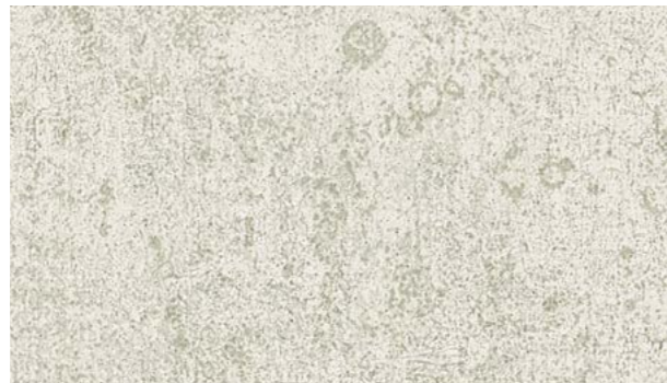
VSTO 9171 01 54