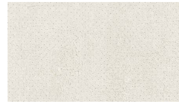
VSTO 9054 01 95