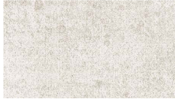
VSTO 9171 10 22