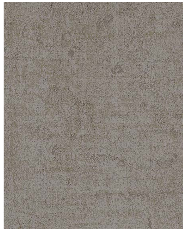
VSTO 9171 11 05