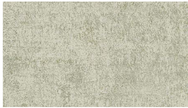
VSTO 9171 04 48